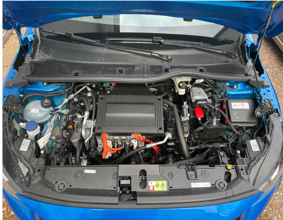
CC BY-SA 4.0 Tomás Freres - Motorraum Peugeot e208.jpg (2021)

etwas ist anders: Elektromotor mit Leistungselektronik statt Verbrennungsmotor