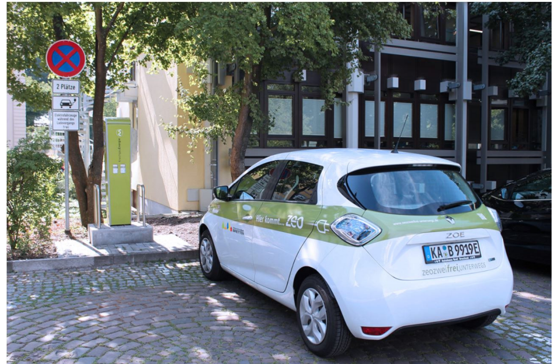
Ladestation in Bretten am Rathaus für zwei Fahrzeuge